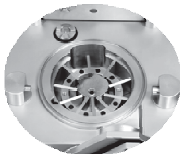
Rotor 10 łopatek.